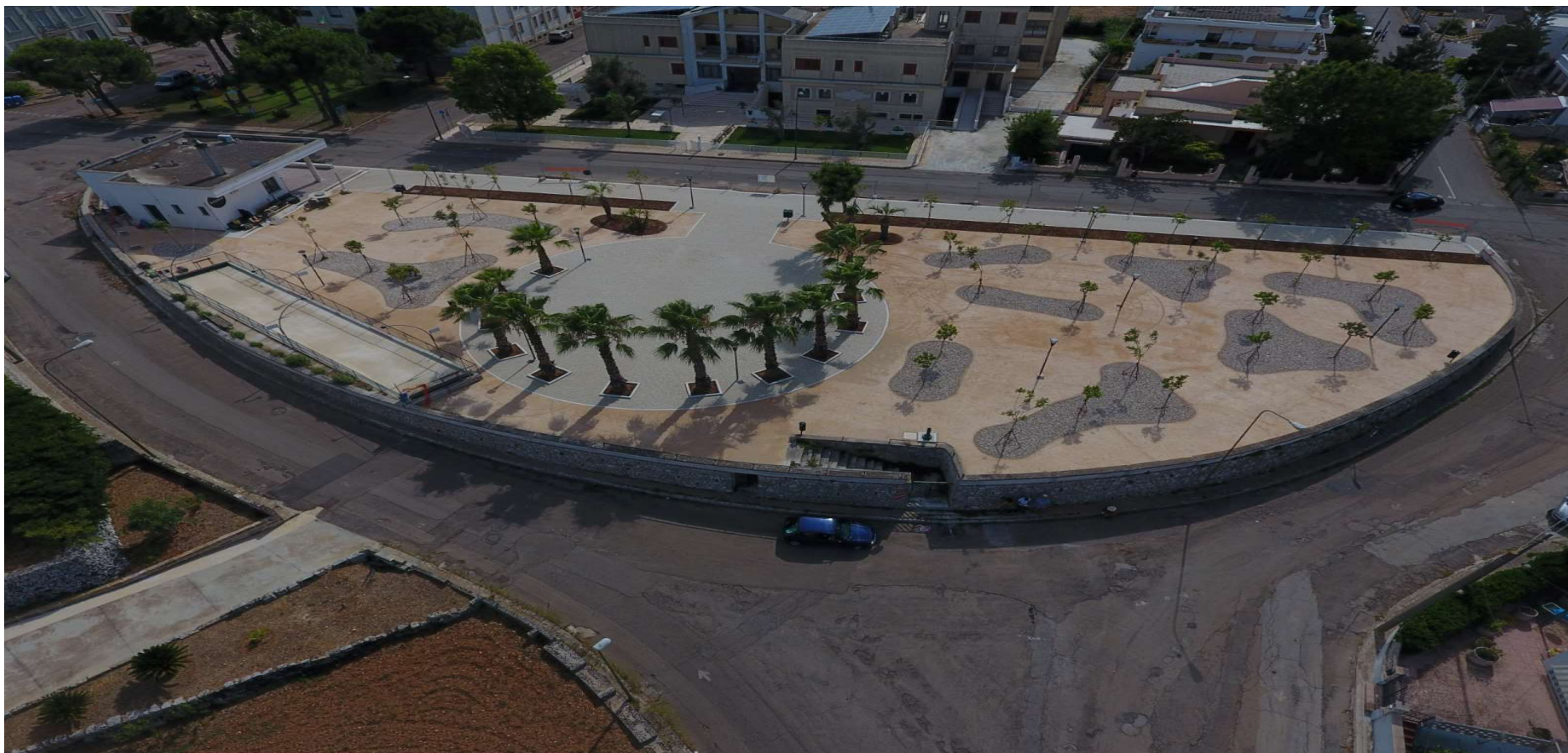
ALLEGATO - PLANIMETRIA GENERALE AREA CHIOSCO/BAR VILLETTA "A. Moro"